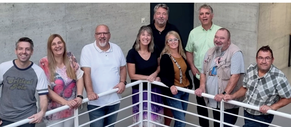
L'équipe de RADIO R, prête à relever le défi !

1 informations ci-dessous ou sur radio-r.ch/don